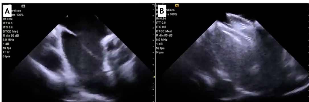
FIGURA 2. Ultrasonografía intracavitaria durante el cierre de CIA. A) Defecto abierto. B) Defecto cerrado luego del implante del dispositivo.

La paciente evolucionó favorablemente, otorgándose el alta sanatoria a las 24 horas del procedimiento. Se indicó la siguiente medicación al alta: Aspirina 100 mg cada 24 horas, Clopidogrel 75 mg cada 24 horas.