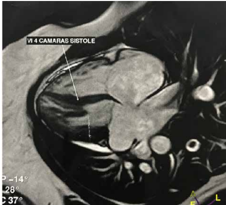
FIGURA 1. RMI cardíaca que muestra dextrocardia.